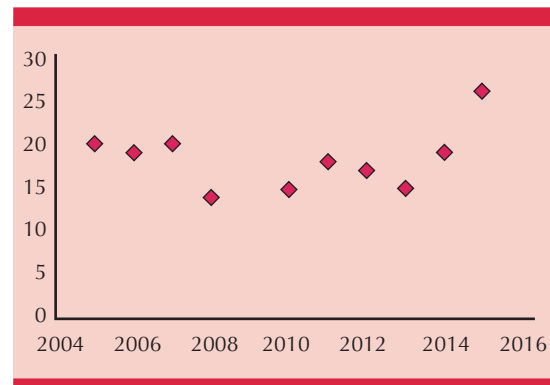
Figura 1. Distribución de los casos de cáncer de piel en menores de 40 años de 2005 a 2015.

La distribución del cáncer de piel en menores de 40 años fue la siguiente: carcinoma basocelular 52%, melanoma 39% y carcinoma espinocelular 9% (Figura 2).